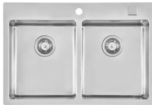
水槽 KE Filotop